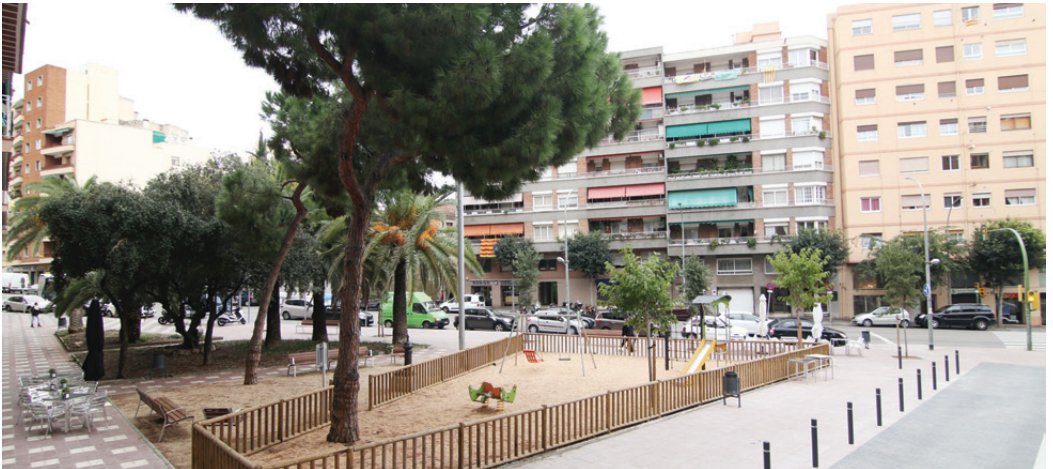
La plaça que demanen que porti el seu nom, on hi havia pintures Civit