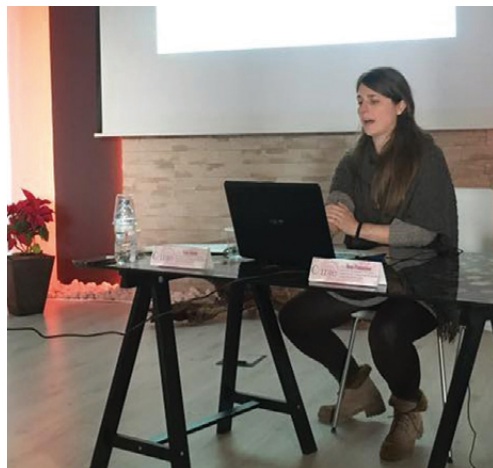
D. Ferrer i cedida